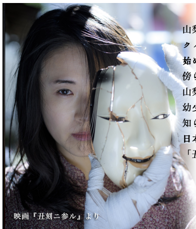
映画『丑刻ニ参ル』より

山梨県出身。2006年初代ヴァンフォーレクィーンに選ばれ、女優として活躍を始める。NHK大河時代劇に連続出演する傍ら、「やまなし大使」として全国に山梨県の魅力を伝え続けている。幼少時より心霊体験が異様に多いことでも知られ、最新作『丑刻ニ参ル』では日本映画に久々に登場したホラー・ヒロイン「丑刻さん」を見事に演じきっている。