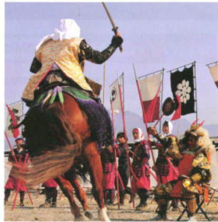
川中島合戦戦国絵巻